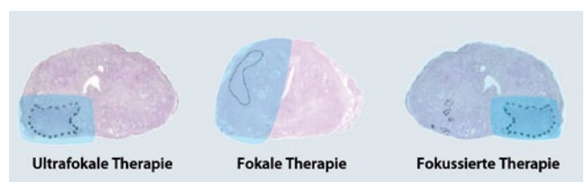
Abb. 1: Formen der fokalen Brachytherapie [nach 10]

Die Möglichkeiten der fokalen Therapie sind für den unsicheren Patienten zunächst vielversprechend, da die Active Surveillance Überwachung bzw. das Watchful Waiting für viele Patienten zu einer psychologisch manchmal schwer ertragbaren Situation zwischen der Angst vor einem Tumorprogress und der Angst vor Therapienebenwirkungen führt. Es bedarf daher der sorgfältigen Aufklärung jedes potentiell an einer fokalen Therapie interessierten Patienten, dass gerade die psychologische Belastungen von unweigerlich gehäuften Tumorrückfällen und der damit verbundenen Rezidivdiagnostik ebenfalls schwerwiegend sein können.